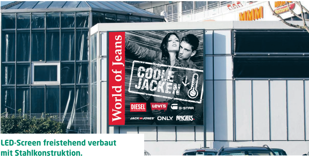
LED-Screen freistehend verbaut mit Stahlkonstruktion.

Das Mythen Center Schwyz darf in der Region Innerschwyz als Pionier beim Einsatz der zukunftsweisenden LED-Screens gelten.